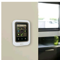
TYBOX 2010 WT

Gestionnaire d'énergie pour 2 zones distinctes de votre domicile et indicateur de consommations toutes énergies