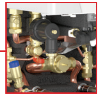
Filtre magnétique à tamis

Tous les composants sont accessibles par l'avant. Les principaux composants hydrauliques sont déjà intégrés (disconnecteur, soupapes de sécurité chauffage et sanitaire...)