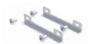
Fixation de base Smart Kit - Réf 89404