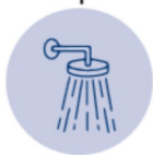
DOUCHE DE TÊTE