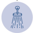
CIEL DE PLUIE