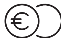
ÉCONOMIE D'ÉNERGIE Détection automatique d'ouverture/fermeture de fenêtre