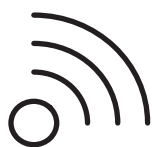
CONNECTÉ EN OPTION (1) Programmation à distance avec l'application Thermor Cozytouch